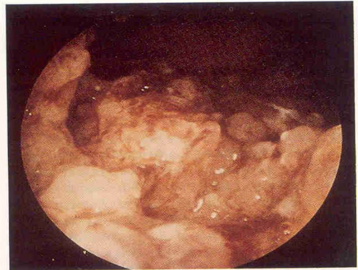
Fig. 4.13 The hysteroscopic appearance of endometrial carcinoma.