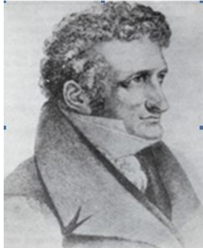
Juan M Gaspar Itard (1775-1838)