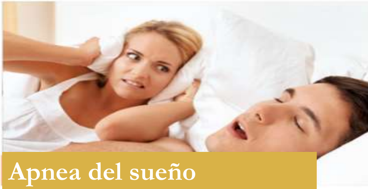
Apnea del sueño